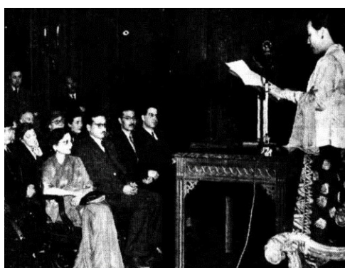
Gambar 1. Hurustiati Soebandrio ketika memberikan ceramah mengenai emansipasi perempuan Indonesia di hadapan pejabat diplomatik di Islamic Cultural Centre, London.

1952 ( Indian Daily Mail 27 Januari 1952:3). Di Islamic Cultural Centre itu pula, Hurustiati Soebandrio juga pernah memberikan ceramah dengan tema yang sama di hadapan para pejabat diplomatik dan istrinya. Salah satu tokoh yang pernah mendengarkan ceramahnya adalah Begum Rahmitoola, istri dari pejabat diplomatik Pakistan di Inggris ( The Chronicle 12 Juni 1952:28).