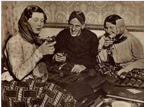
Gambar 2. Permainan Gamelan dalam pementasan yang diadakan oleh Hurustiati Soebandrio.

dekorasi ulang. Dalam kesempatan tersebut, Hurustiati dengan dibantu komunitas Indonesia di Inggris, memperkenalkan kebudayaan mulai dari gamelan hingga mengadakan diskusi terbuka dengan para tamu undangan untuk membicarakan berbagai jenis kebudayaan Indonesia. Bahkan, upaya Hurustiati berhasil menarik perhatian dari tamu undangan. Karenanya, beberapa tamu seperti Johanna Beun dan Karel Noordhoff tertarik untuk bergabung dalam kelompok musik gamelan.